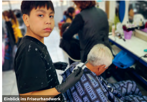
Einblick ins Friseurhandwerk