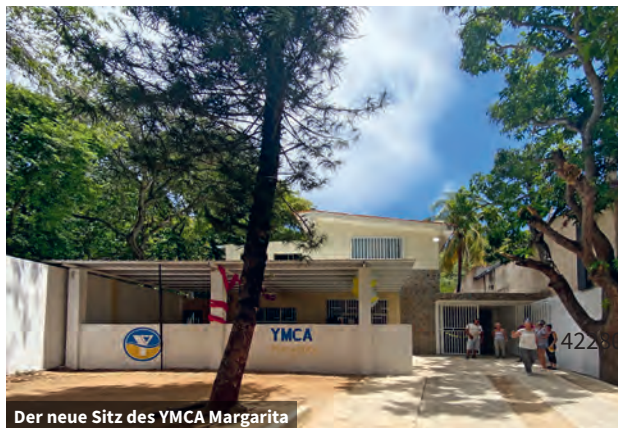
Der neue Sitz des YMCA Margarita

Jedes Jahr können 60 Kinder in das Bildungsprogramm des YMCA Margarita aufgenommen werden. Sie kommen von Montag bis Freitag nachmittags zum YMCA, wo sie in vier Altersklassen unterrichtet werden. Gemeinsam lernen sie lesen, schreiben und rechnen, sodass eine solide Grundbildung gewährleistet ist. Alle vier Monate werden ihre Fortschritte durch verschiedene Tests dokumentiert und weiterer Förderbedarf ermittelt. Spielerisch erkunden die Kinder verschiedene Themen, und das Angebot wird ständig erweitert, da sich immer mehr Ehrenamtliche bereit erklären, die Arbeit zu unterstützen. Seit einigen Monaten gibt es beispielsweise eine Theatergruppe, die von einer ausgebildeten Schauspielerin geleitet wird, die durch eine Bekannte von der Arbeit des YMCA erfahren hat und begeistert einen Beitrag leisten wollte.