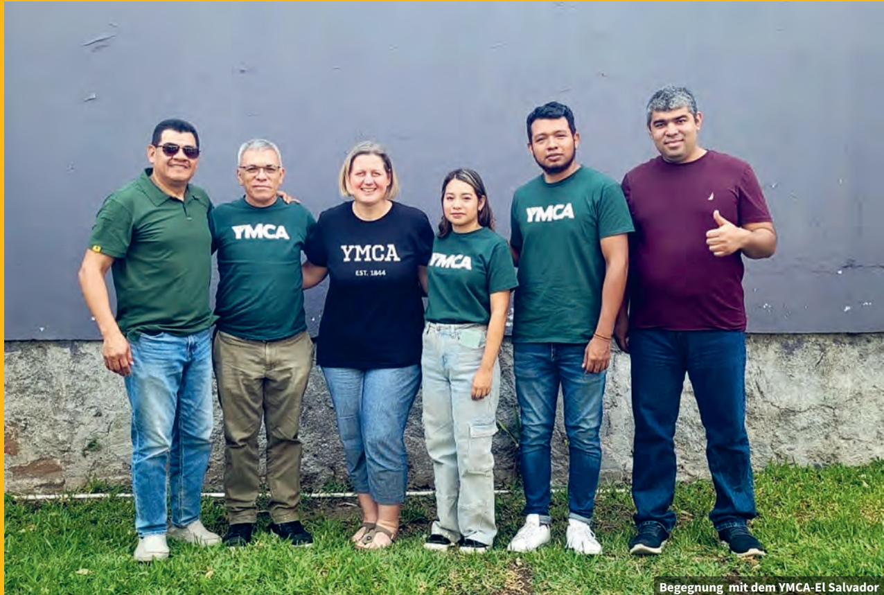
Begegnung mit dem YMCA-El Salvador