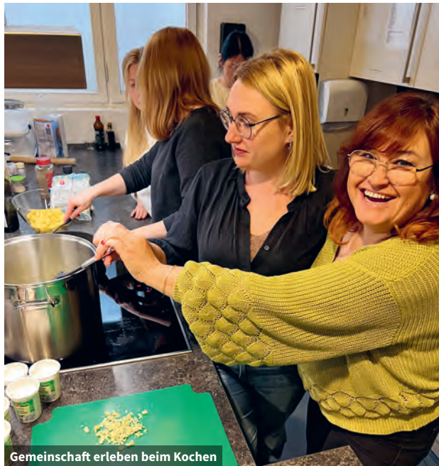
Gemeinschaft erleben beim Kochen

Im Rahmen des Projekts sind Kunsttherapie-Workshops und andere kreative Angebote geplant, die den Frauen Entspannung ermöglichen und ihnen helfen, positive Gedanken zu entwickeln. Geplant sind auch Treffen bei Kaffee und Gesprächen, Gruppenarbeit sowie – bei Bedarf – Einzelgespräche mit Psychologen, um therapeutische Unterstützung anzubieten. Besinnungstage für aktive Teilnehmerinnen des Programms sollen die Gemeinschaft stärken und eine Gelegenheit zur emotionalen Entlastung bieten.