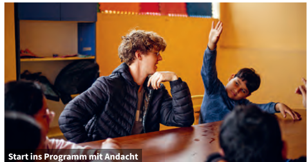
Start ins Programm mit Andacht

Das Projekt wird in Lima, Arequipa und Trujillo mit insgesamt 150 Teilnehmenden durchgeführt und hat drei Interventionslinien.