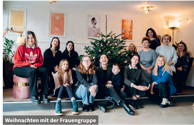
Weihnachten mit der Frauengruppe

Durch die Schulung von YMCA-Teams in Erster Hilfe für psychische Gesundheit können die Mitarbeiterinnen angemessen auf Panikattacken, Nervenzusammenbrüche und ähnliche Situationen reagieren und bei Bedarf rechtzeitig professionelle Hilfe empfehlen. Wir sind unglaublich dankbar für die Möglichkeit, das Projekt „One for Another“ in der Ukraine umzusetzen. Zuvor habe ich dieses Programm zusammen mit Kollegen aus dem CVJM Bayern in Nürnberg durchgeführt und gesehen, welcher positiven Effekt es auf den emotionalen Zustand der Frauen aus der Ukraine hatte, die aufgrund des Krieges nach Deutschland kamen. Die Frauengemeinschaft, die dort durch unser Projekt entstanden ist, wurde für viele Ukrainerinnen zu einer Basis für ihre Entwicklung, zu ihrem ruhigen Hafen in einem stürmischen Meer von Gedanken über den Krieg und der Unsicherheit über ihre Zukunft. Ich habe gesehen, wie der CVJM für viele Ukrainerinnen in Deutschland zu einem Hoffnungsort wurde und weiß, dass er auch in der Ukraine so wirken kann. Die Nöte sind dort enorm, und dieses Projekt wird eine starke Ergänzung zu den bestehenden Programmen sein und, so hoffe ich, vielen Frauen die Möglichkeit geben, emotionale Unterstützung zu erhalten, ihre Resilienz zu stärken, Freundinnen zu finden, ihr Potenzial zu entfalten und eine verlässliche Unterstützung im YMCA zu finden.