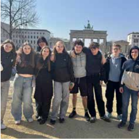
KonfiWochenende in Berlin im März 2025