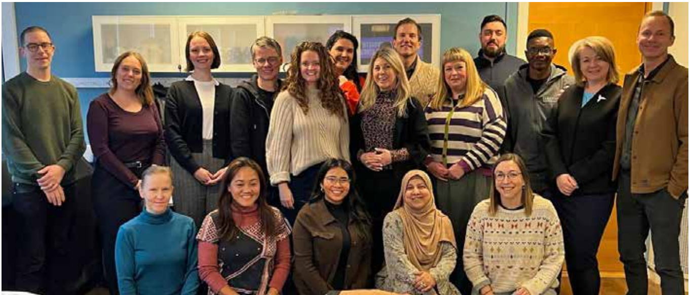
Treffen vom Internationalen Team für Movement Strengthening des World YMCA

Evaluierung und Reflexion: Am Ende steht eine ehrliche Auswertung: Was hat funktioniert? Was nicht? Welche Erkenntnisse nehmen wir mit? Auf dieser Basis beginnt der Zyklus erneut.