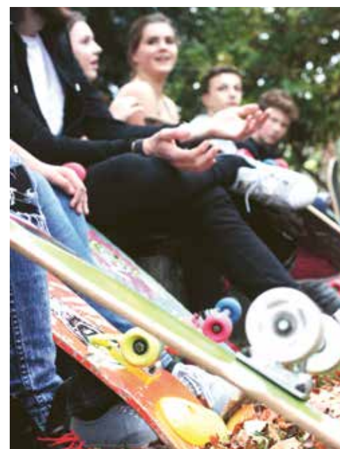
Begegnungen dort ermöglichen, wo Menschen sich aufhalten.

Grundsätzlich verstehen wir unsere Arbeit sozialräumlich: Wir sind mit unseren Angeboten genau dort unterwegs, wo Menschen leben – in den Stadtteilen, auf Plätzen, in Schulen und Einrichtungen. Gemeinsam mit den Menschen vor Ort entwickeln wir passgenaue Angebote.